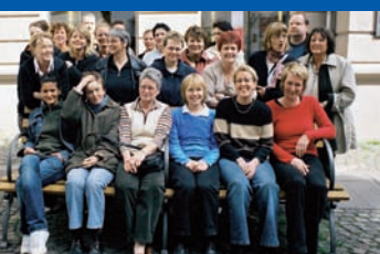
MitarbeiterInnen des Hauspflegevereins e.V.

Hauspflegeverein e.V. August-Bebel-Str. 133 a 33602 Bielefeld